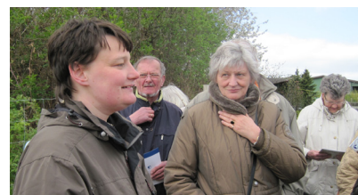
Erläuterungen der Züchterin zur Alpacazucht