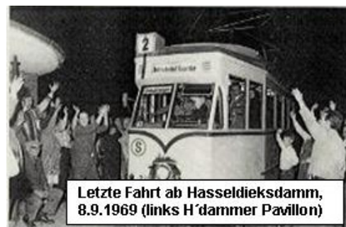
Letzte Fahrt ab Hasseldieksdamm, 8.9.1969 (links H'dammer Pavillon)