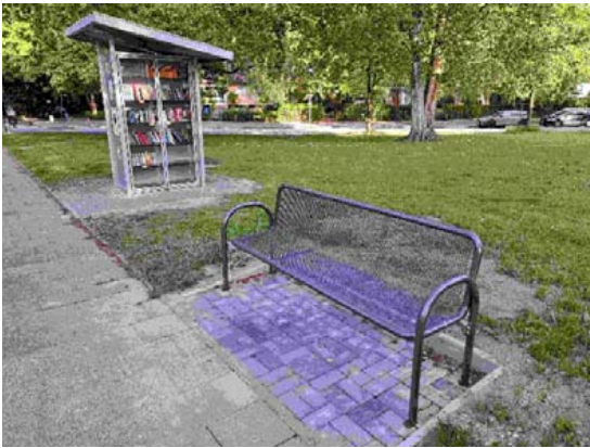
Neue Bank am Bücherhäuschen

Schön, dass wir es haben und dass es so gut angenommen wird, unser Bücherhäuschen! Dank unserer ehrenamtlichen Helferinnen, ja, es sind alles Frauen, ist das Angebot immer in einem guten Zustand. Vielen Dank für Euer Engagement!