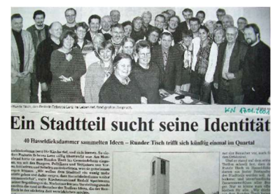
Ein Stadtteil sucht seine Identität

Seit 2001 ist der „Runde Tisch“ ein fester Bestandteil im öffentlichen Leben des Stadtteils. Er wird wahr genommen – von den Menschen im Stadtteil, von Politik und Verwaltung. Vertreter und Vertreterinnen aus Parteien, Vereinen oder dem Ortsbeirat wirken genauso mit. Angehörige der Gemeinde, Vertreter anderer Konfessionen und Menschen, die keinen